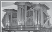
Ev. Schlosskirche Beilstein