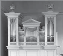
Ev. Kirche Mittenaar-Bicken