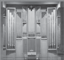
Ev. Stadtkirche Herborn