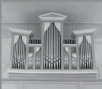
Ev. Kirche Driedorf